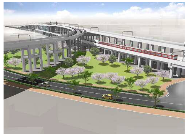
コンパクト・プラス・ネットワーク 知立連立