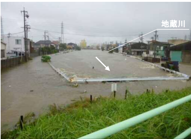
再度災害防止対策の推進 八田川・地藏川