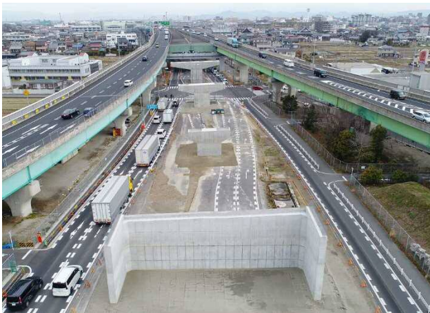
IC アクセス道路の整備 西尾張IC（仮称）

成長力を高め、国土強靱化を加速し、生産性向上に資する 愛知県の社会資本整備の推進について