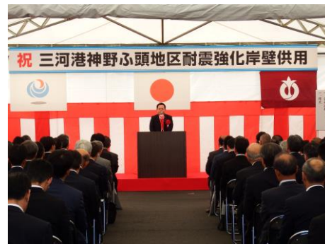
三河港神野ふ頭地区 耐震強化岸壁供用式典