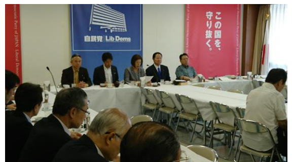
自民党内閣第一分會 部会長代理を務めております