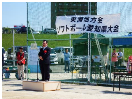
東海地方郵便局長会 ソフトボール愛知県大会