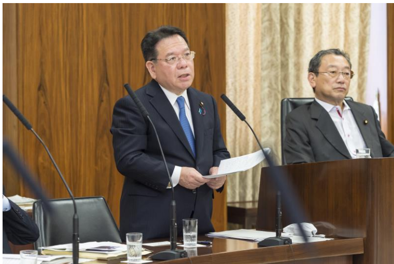
5月17日 国土交通委員会 バリアフリー法案について質問いたしました