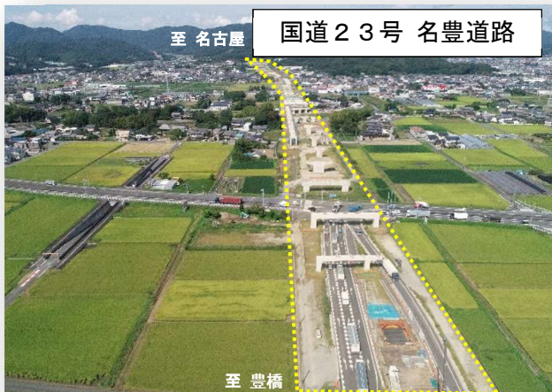
国際競争力を強化する広域道路ネットワークの整備推進