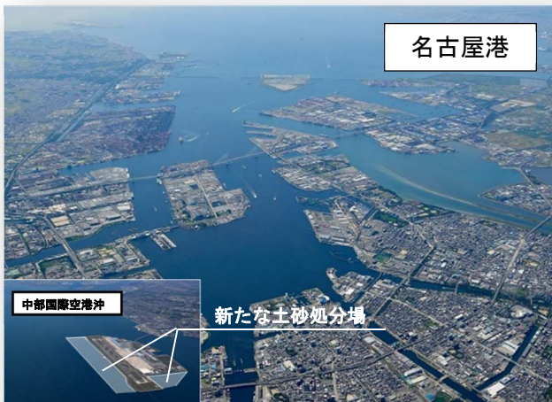
国際競争力を強化する港湾整備の推進