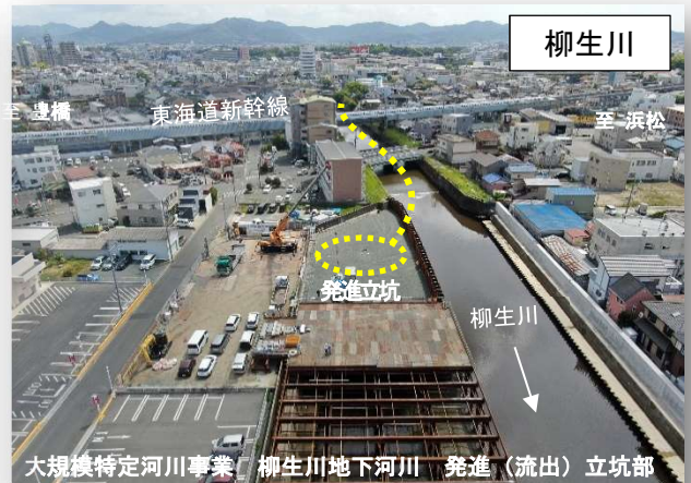
大規模特定河川事業 柳生川地下河川 発進（流出）立坑部 流域治水の本格的展開による事前防災対策の推進